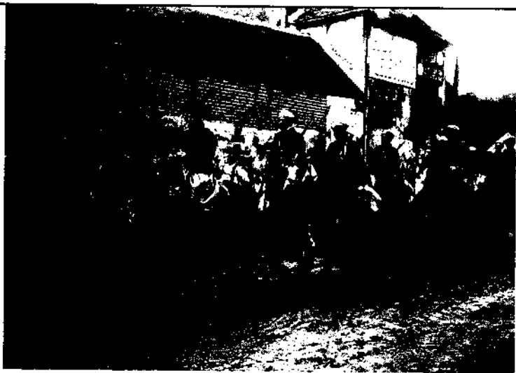
Des spahis, à Ribécourt (Oise), pendant la Première Guerre mondiale.

La modernisation a, au contraire, pour effet d'accroître le fossé entre les indigènes et les colons. Jusqu'à, ces derniers avaient besoin des Algériens, avec qui ils nouaient des rapports paternalistes, pour travailler dans les propriétés agricoles. Avec la mécanisation, les rapports se distendent et la condition de la popu-