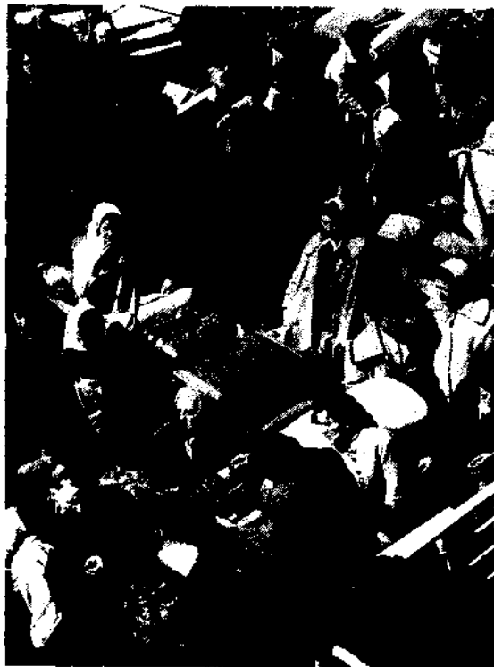
1962. Des rapatriés arrivent en France, à bord du Ville-de-Marseille.

Deux vétérans français, le fils d'un modéré arabe assassiné, un fils de harki, les témoignages recueillis par Patrick Rotman et le journal édité par Larousse... pour comprendre le drame franco-algérien