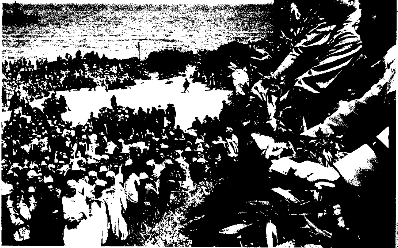
Lors du soulèvement de Sétif, le 8 mai 1945.

●●● besoin, du point de vue gaulliste, de faire la preuve que la France est encore une grande nation, capable de se relever. Et, notamment, de disposer de nouveau d'une armée puissante. Or les pieds-noirs vont beaucoup contribuer à cette nouvelle armée : les jeunes, en particulier, se sont engagés en masse dans les corps francs d'Afrique, qui vont participer activement à la libération de la Tunisie. La moitié des engagés périront, notamment durant la prise de Bizerte, contre les blindés allemands. Et ce sont eux qui entreront les premiers à Bizerte. Même si les Forces françaises libres, qui s'étaient battues vaillamment en Tripolitaine, en particulier à Bir Hakeim, leur volent la vedette lors du défilé victorieux à Tunis, en mai 1943. L'armée d'Algérie se modernise avec le matériel américain, se gonfle par la mobilisation des jeunes classes des deux communautés ; elle saura s'illustrer sur les théâtres italiens.