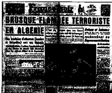
Les attentats d'Algérie, à la Une (France-Soir du 2 novembre 1954).