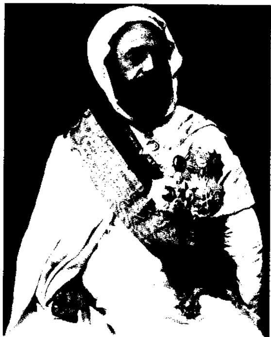
Abd el-Kader (vers 1875).