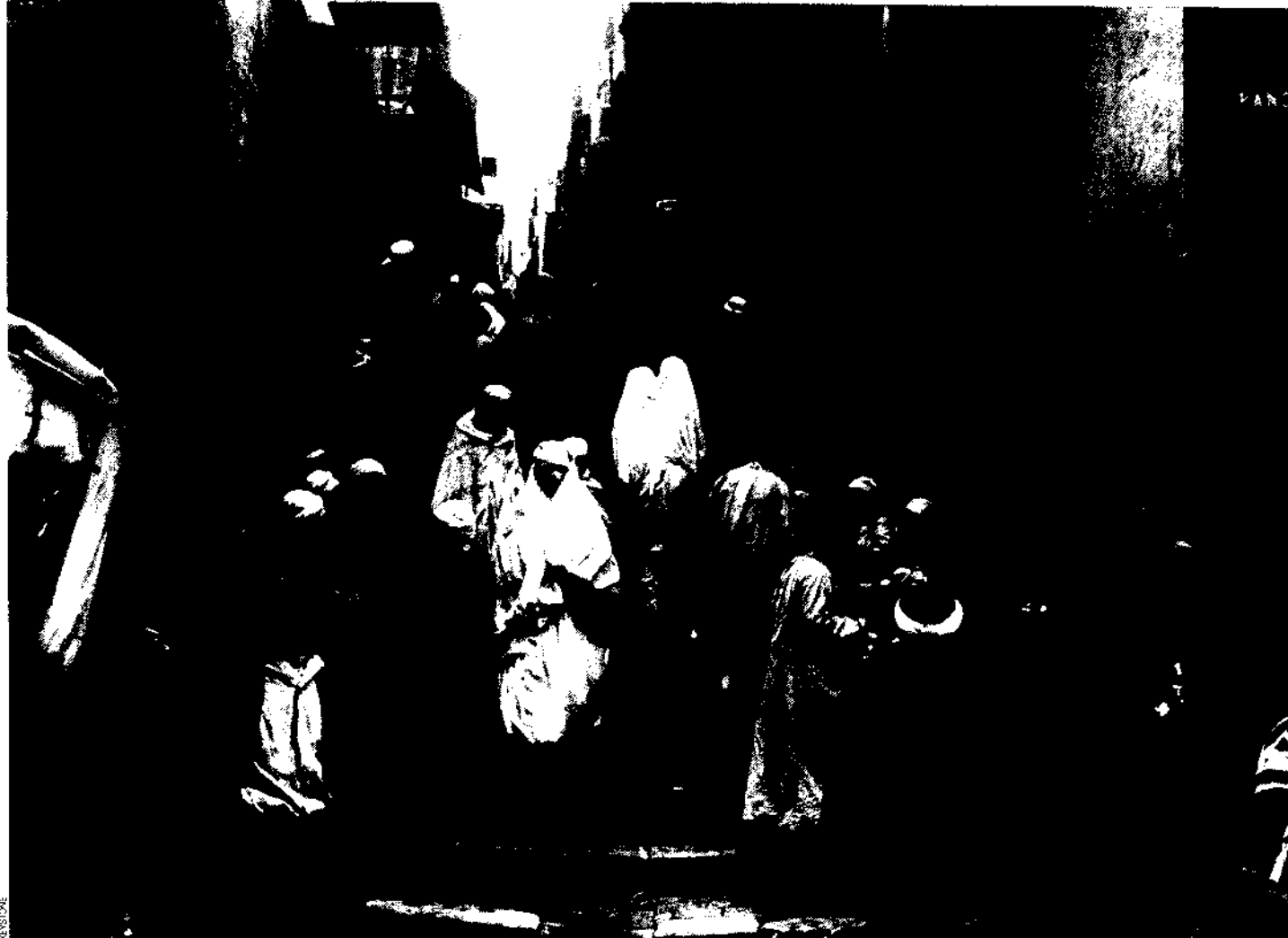
La casbah (quartier arabe) d'Alger, en 1930.

mais par des Américains. Les Algériens touchent du doigt la vulnérabilité et l'effondrement français. Une révolution intellectuelle s'opère : les Algériens se mettent à penser que le moment est venu de réagir.