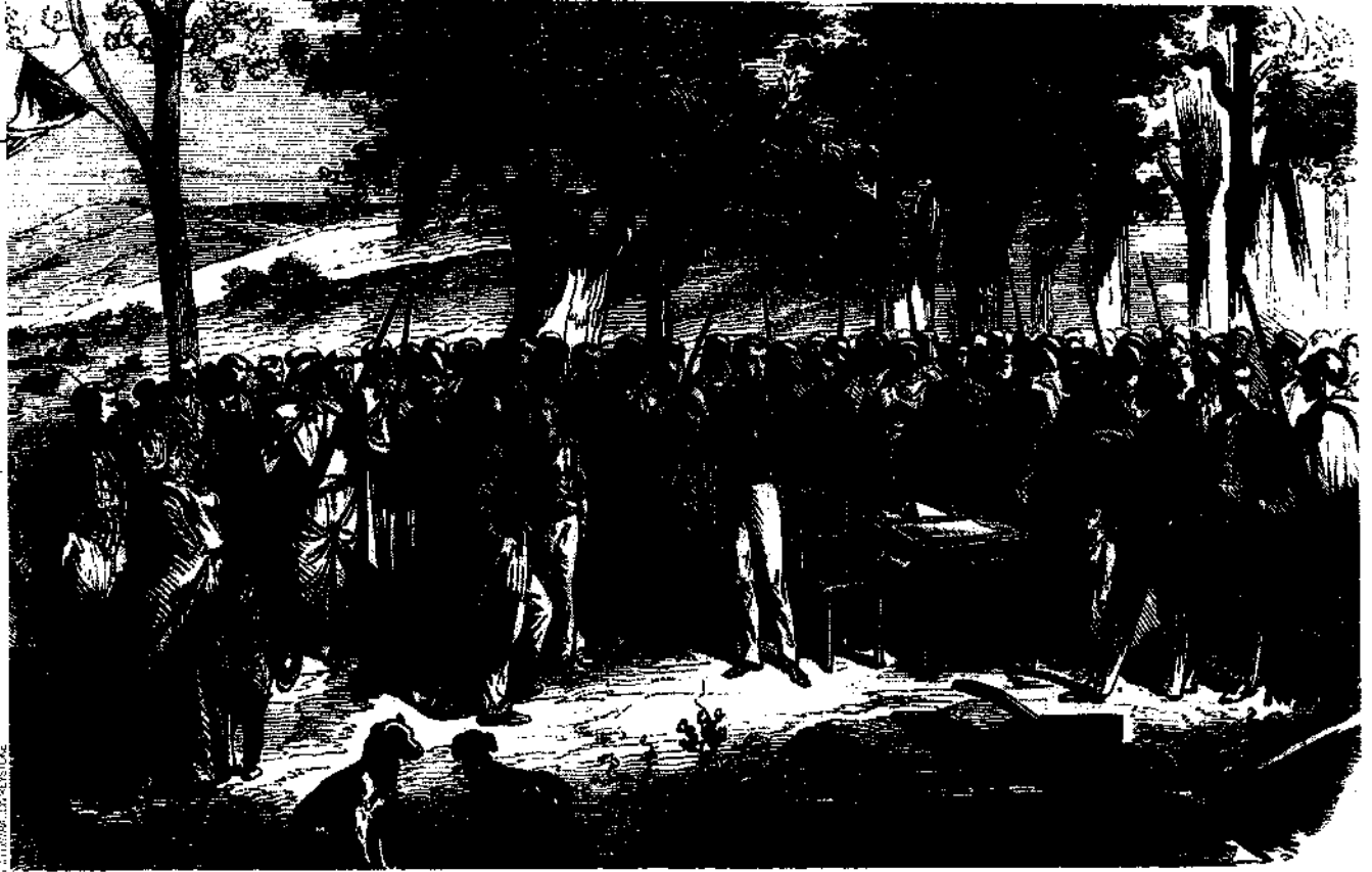
Le préfet d'Algier distribuant des lots de terrains aux concessionnaires du village Rivet (gravure publiée dans L'Illustration , en 1856).

difficilement de se soumettre à une autorité extérieure. De 1840 à 1847, la lutte se résume à un duel entre Bugeaud, conquérant et colonisateur, et Abd el-Kader. Le Maroc encourage la résistance algérienne, mais doit s'incliner après défaite et bombardements. Abd el-Kader, isolé, échoue dans sa tentative d'unification de toutes les résistances. Face aux renforts militaires envoyés par les Français, il doit céder du terrain et se replier sur les hauts plateaux. En 1843, sa smaïa , sa ville nomade, à la fois son gouvernement et sa capitale, est prise par l'armée française. Abd el-Kader fuit, est refoulé au Maroc. Il se rendra en 1847. Pourtant, la résistance algérienne continue.