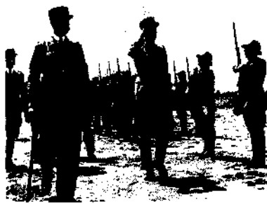
Giraud (à g.) et de Gaulle saluant les gardes mobiles, sur un aéroport algérien, en 1943.

Le fait de voir les Français s'entre-déchirer, voire s'entre-tuer, achève de discréditer la France et nourrit l'aspiration à l'indépendance. Prenez l'assassinat de Darlan, en décembre 1942. C'est un épisode lamentable qui projette sur le devant de la scène le comte de Paris, lequel vivait en exil au Maroc. A la faveur de la pagaille politique, ce dernier est sollicité pour une restauration monarchique, avec le titre potentiel de « lieu-