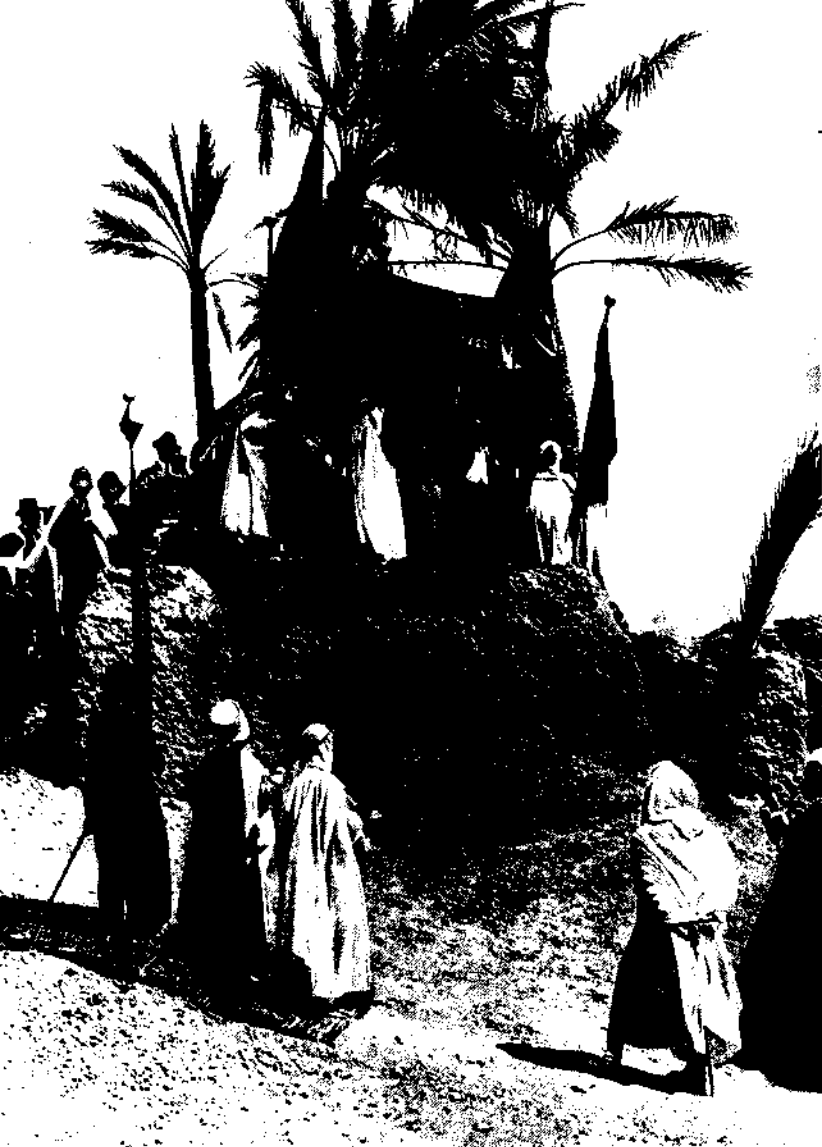
Le président Millerand, lors d'une visite officielle, en mai 1922.

les Algériens l'avaient voulu, cette assimilation, ils en avaient rêvé, ils étaient prêts. Une fois encore, ils doivent déchanter. Une fois encore, l'espoir retombe. Et c'est donc par déception que les Algériens vont commencer à se tourner vers autre chose : l'idée séparatiste.