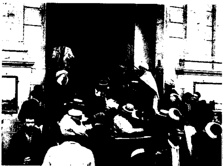
Un bureau de vote, à Alger, en 1902.