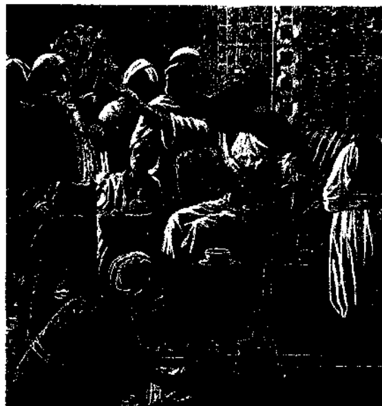
Le coup d'éventail du dey d'Alger au consul Deval.