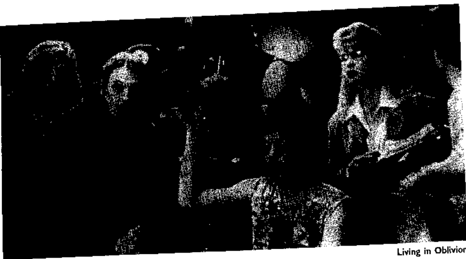
Living in Oblivion