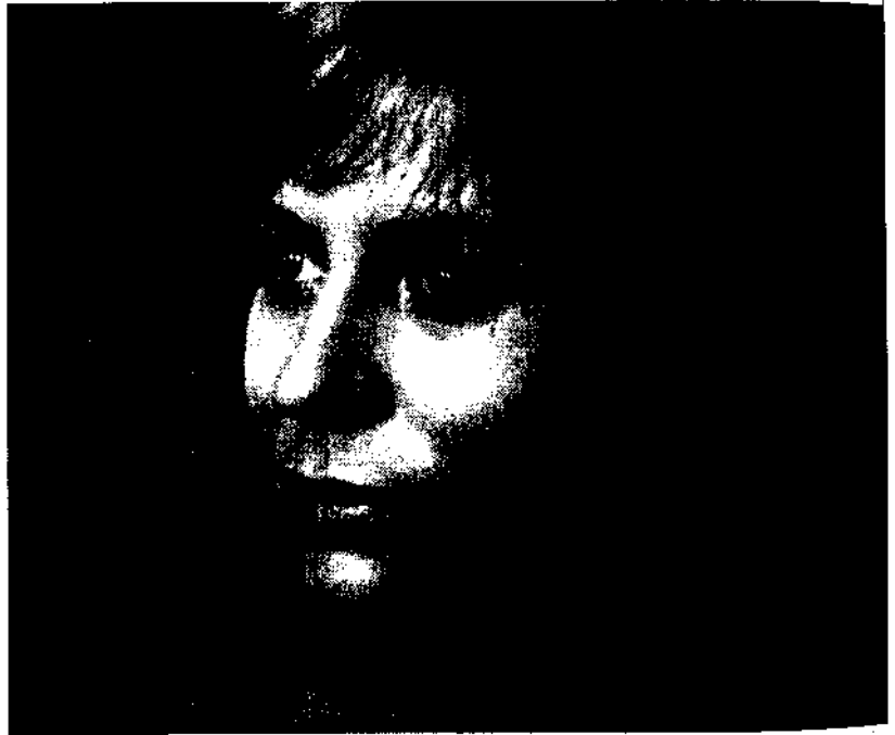
Margarethe von Trotta dans Feu de paille

Collaboration, c'est beaucoup dire. Avec Fassbinder, en tant qu'actrice, j'ai appris en observant comment il illustrait ses idées et construisait ses scènes. C'était quelqu'un qui savait exactement ce qu'il voulait. Tous les autres metteurs en scène que j'ai connus avaient leurs moments de doute (où mettre les rails, comment filmer tel plan...). Mais Fassbinder, lui, savait tout de suite